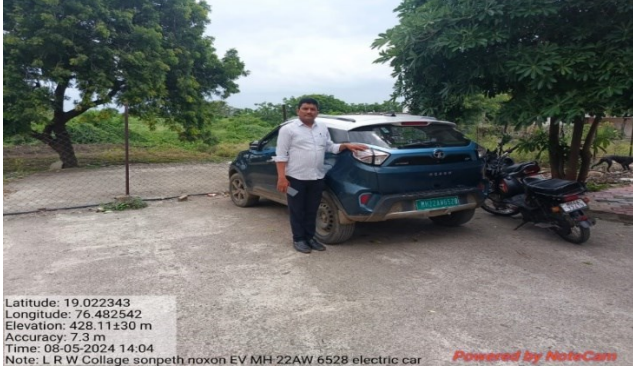
Use of E-Vehicle by Faculty