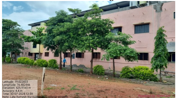
Plantation beside college