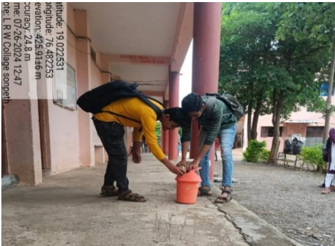
Dustbin for degradable and non-degradable waste for each wing