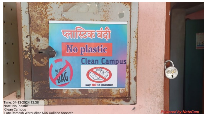
Plastic Ban Campaign