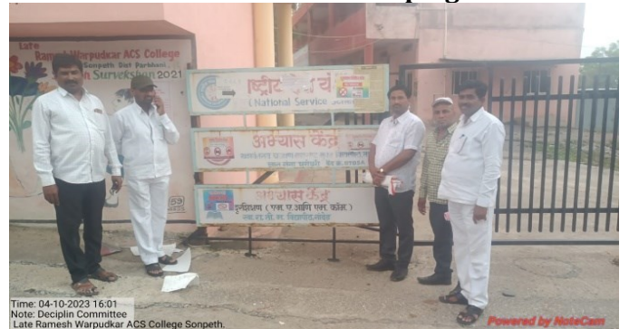
No Vehicle Day