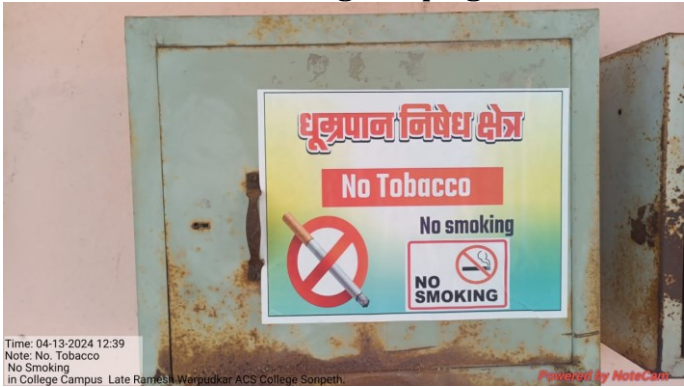
Time: 04-13-2024 12:39 Note: No. Tobacco No Smoking in College Campus Late Ramesh Warpukar ACS College Sonpeth