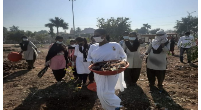
Work for Clean Campaign