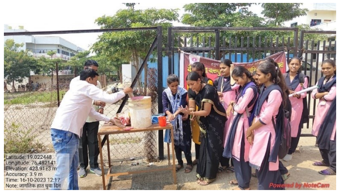
Hand Wash Campaign