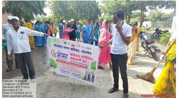
Work for Clean Campaign