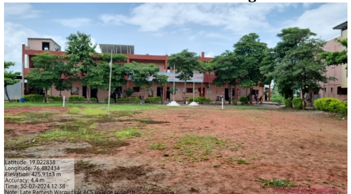
Main Building and Ground