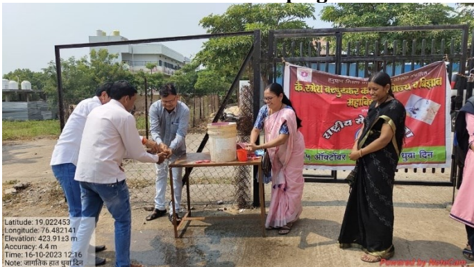
Hand Wash Campaign