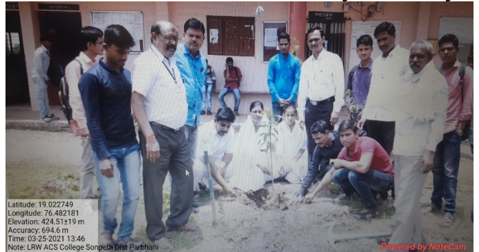
Plantation on occasion of Birthday of Faculty

Latitude: 19.022749 Longitude: 76.482181 Elevation: 424.51±19 m Accuracy: 694.6 m Time: 03-25-2021 13:46 Note: LRW ACS College Sonpeth Dist Parbhani