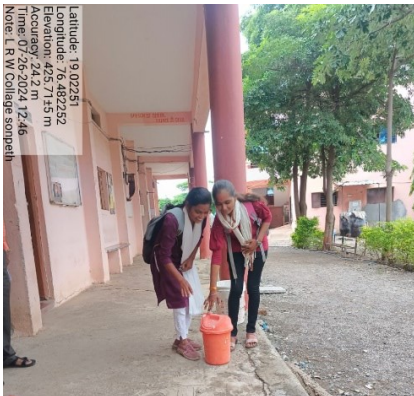
Dustbin for degradable and non-degradable waste for each wing