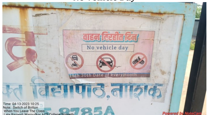
No Vehicle Day