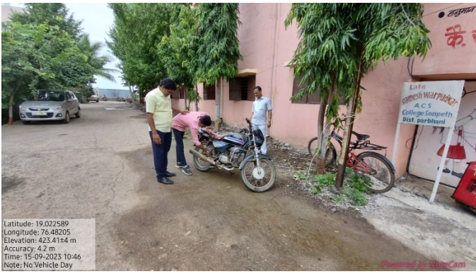
Restriction for Use of vehicle on -No Vehicle Day